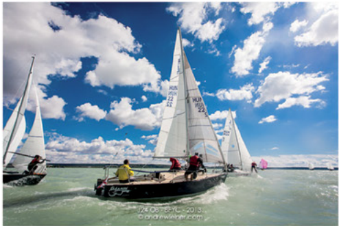
J24 08 - BYC - 2013