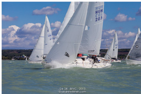
J24 08 - BYC - 2013