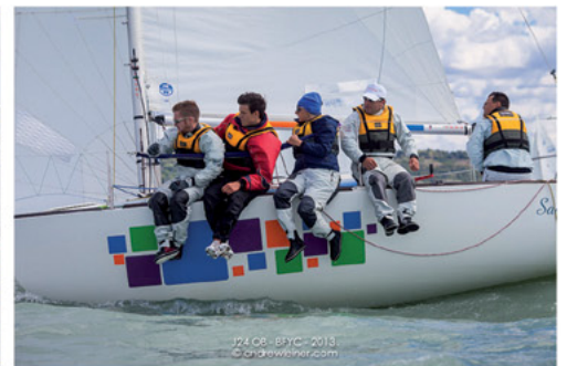
J24 08 - BYC - 2013