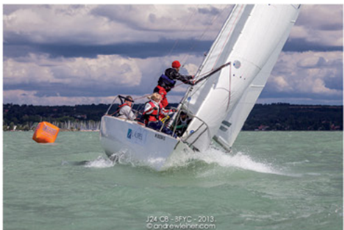
J24 08 - BYC - 2013