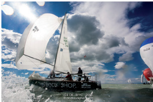
J24 08 - BYC - 2013