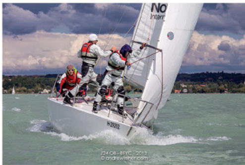
J24 08 - BYC - 2013