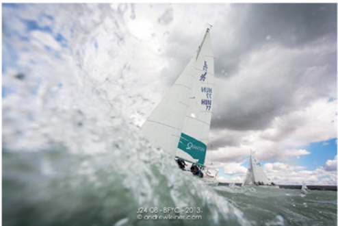
J24 08 - BYC - 2013