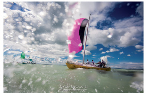
J24 08 - BYC - 2013